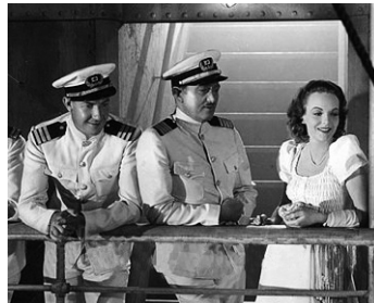
1940 LA MAISON DES SEPT PÉCHÉS (Seven Sinners) de T. Garnett avec J. Wayne, Anna Lee