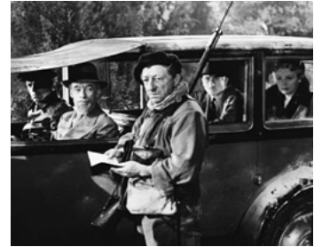
1938 BLOCUS (Blockade) de William Dieterle avec Paul Muni, Madeleine Carroll