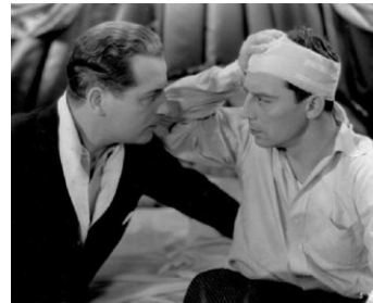
1930 BUSTER SE MARIE (Parlor, Bedroom and Bath) d'Edward Sedgwick avec Buster Keaton