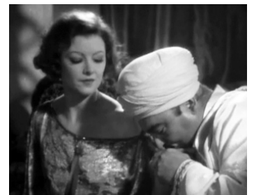
1933 LE CHANT DU NIL (The Barbarian) de Sam Wood avec Myrna Loy