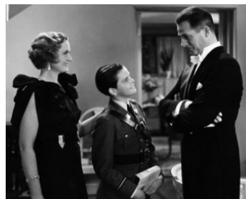
1933 UNE NUIT SEULEMENT (Only Yesterday) de John M. Stahl avec Billie Burke