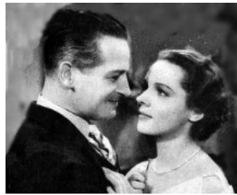
1934 SUR L'AUTRE RIVE (One more River) de James Whale avec Diana Wynyard