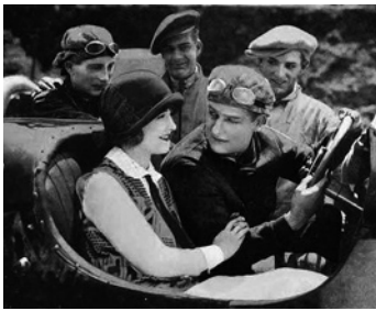
1924 LA COURSE INFERNALE (Sporting Youth) de Harry A. Pollard avec Laura La Plante