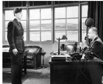
1941 ESCADRILLE INTERNATIONALE (International Squadron) de Lewis Seiler avec Ronald Reagan