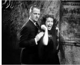
1938 QUATRE HOMMES ET UNE PRIÈRE (Four Men and a Prayer) de J. Ford avec Loretta Young