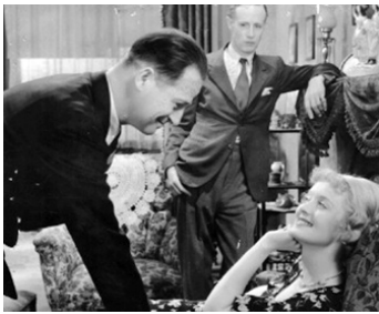
1934 L'EMPRISE (Of Human Bondage) de John Cromwell avec Leslie Howard, Bette Davis