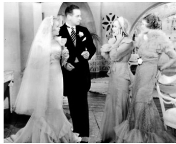
1934 WE'RE RICH AGAIN de William A. Seiter avec Billie Burke, Marian Nixon, Joan Marsh