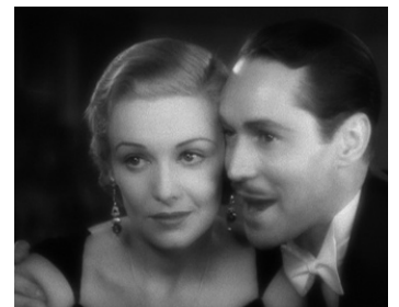
1934 LE MONDE EN MARCHÉ (The World moves on) de John Ford avec Madeleine Carroll