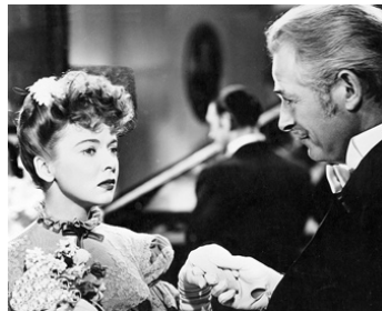
1947 TU NE M'ÉCHAPPERAS PAS (Escape me never) de Peter Godfrey avec Ida Lupino