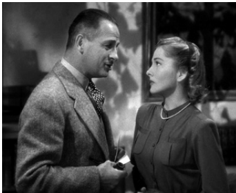
1940 REBECCA (Rebecca) d'Alfred Hitchcock avec Joan Fontaine