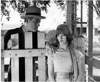
1926 BUSINESS IS BUSINESS (Rolling Home) de William A. Seiter avec Margaret Seddon