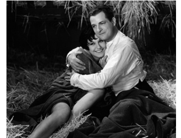
1930 THOSE THREE FRENCH GIRLS de Harry Beaumont avec Fifi d'Orsay