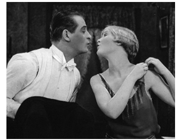
1926 L'HABIT FAIT LE MOINE (Skinner's Dress Suit) de William A. Seiter avec Laura La Plante