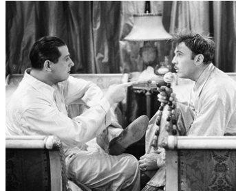
1930 MADAME SATAN (Madam Satan) de Cecil B. De Mille avec Roland Young