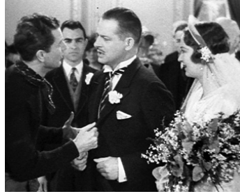
1935 UNE FEMME À BORD (Vagabond Lady) de Sam Taylor avec B. Churchill, Evelyn Venable