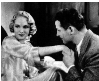
1931 STEPPING OUT de Charles Reisner avec Leila Hyams