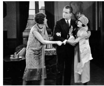
1925 TROP DE FEMMES (I'll show you the Town) de H. Pollard avec Marian Nixon, L. Tashman