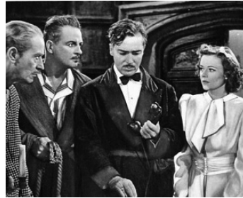
1938 BULLDOG DRUMMOND'S REVENGE de Louis King avec John Howard, H. Angel