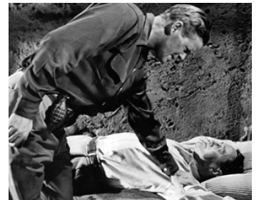
1953 ALERTE À SINGAPOUR (World for Ransom) de Robert Aldrich avec Dan Duryea