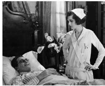
1924 OH ! DOCTEUR (Oh, Doctor !) de Harry A. Pollard avec Myrna Loy