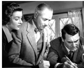
1947 UN MILLION CLEFS EN MAIN (Mr Blandings...) de H. C. Potter avec Myrna Loy, Cary Grant