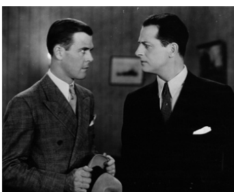
1933 LE GRAND BLUFF (The Big Bluff) de Reginald Denny avec Donald Keith