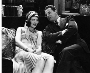
1929 UN MARI PROVISOIRE (Embarassing Moments) de W. J. Craft avec Merna Kennedy