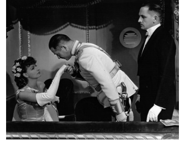
1935 ANNA KARÉNINE (Anna Karenina) de Clarence Brown avec Greta Garbo, Fr. March