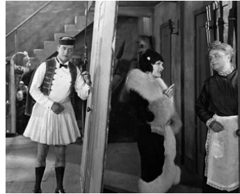
1927 M'SIEUR L'MAJOR (Out all Night) de William A. Seiter avec Marian Nixon