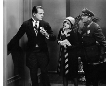
1927 C'EST MON PAPA (That's my Daddy) de Fred C. Newmeyer avec Barbara Kent