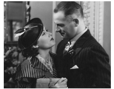
1934 LA PLUS RICHE FILLE DU MONDE (The richest girl in the World) de L. Seiter avec Fay Wray