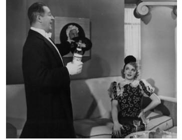
1937 FEMMES DE CHARME (Women of Glamour) de Gordon Wiles avec Virginia Bruce