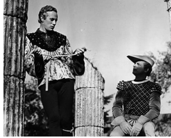
1936 ROMÉO ET JULIETTE (Romeo and Juliet) de George Cukor avec Leslie Howard