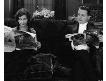
1928 LA MADONE DE CENTRAL PARK (The Night Bird) de F. Newmeyer avec Betsy Lee