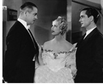
1935 LE MIRAGE DE L'AMOUR (Here's to romance) d'Alfred E. Green avec Anita Louise, Nino Martini