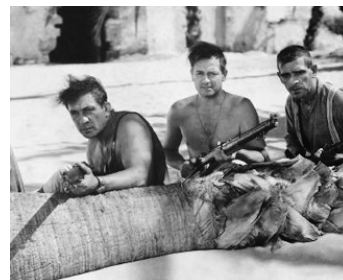
1934 LA PATROUILLE PERDUE (The lost Patrol) de John Ford avec V. McLaglen, Boris Karloff