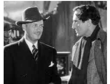
1942 LA VOIX DE LA TERREUR (Voice of Terror) de John Rawlins avec Basil Rathbone