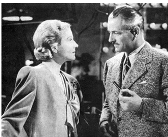
1942 LES YEUX DANS LES TÉNÉBRES (Eyes in the Night) de F. Zinnemann avec Ann Harding