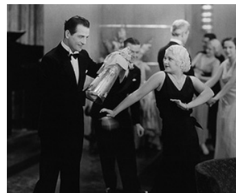
1932 UNE ERREUR JUDICIAIRE (Strange Justice) de Victor Schertzinger avec Marian Marsh